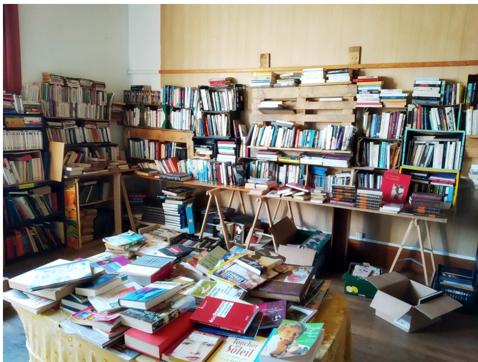
Le coin livres