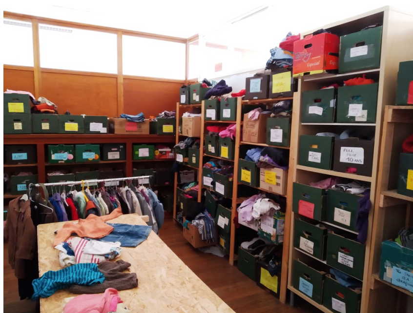
Le coin vêtements enfants

Les personnes qui bénéficient des objets gratuits de la Gratuiterie s'engagent dans un acte citoyen visant à recycler/réutiliser un objet plutôt que d'en acheter un neuf à jeter ensuite. Il peut être pratique, par exemple, quand on a des enfants en bas âge de récupérer des vêtements gratuitement et de les rapporter à la Gratuiterie dès que l'enfant a grandi pour que d'autres puissent les utiliser à nouveau.