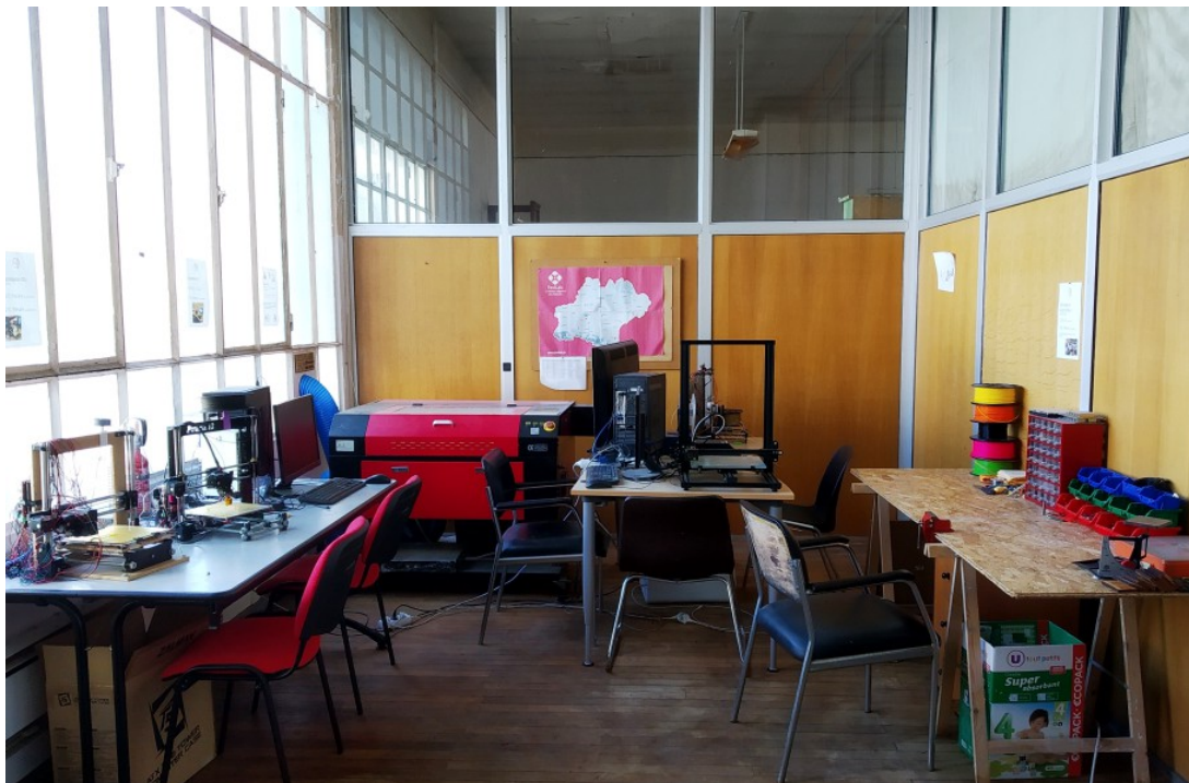
L'atelier Fablab de Mazères

Un des buts du Fablab est de favoriser les initiatives créatives et entrepreneuriales. En période de difficultés économiques, les territoires ruraux présentent un grand potentiel pour le développement économique et la création d'emploi. Les technologies numériques rendent possible l'installation d'entreprises, notamment dans les secteurs des services, et de l'informatique. Le développement à venir des zones rurales assurera un meilleur équilibre entre les territoires. Le présent projet contribuera autant que possible à cette dynamique.